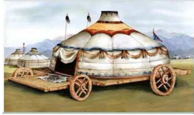
Konar-Göçer Türklere ait tekerlekli gezen yurt (çadır/ev/bark) çizimleri ve resimleri