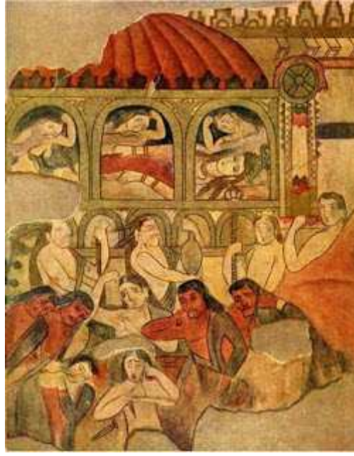
Tacikistan Pencikentte bulunan Gök-Türk Kağanlığı yas merasiminin anlatıldığı tarihi çizim