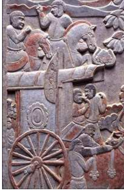
Japonya, Miho Museumda sergilenen 5.YY Gök-Türk Kağanlığı dönemine ait mezar taşı kabartması rölyef üzerindeki tekerlekli Araba üzerindeki Türk Yurtları (Çadır/Ev/Bark)