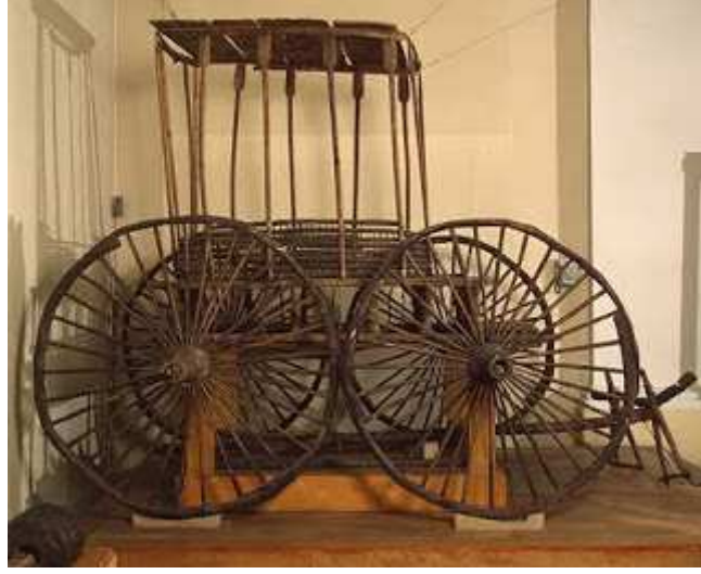
Pazırık İskit-Türk kurganından çıkarılan At Arabasına ait arkeolojik eser